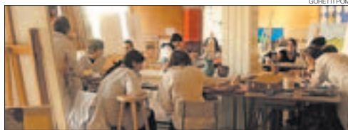
►► Alumnes del col·legi Escolàpies-Llúria elaboren les composicions.

Els establiments on es poden veure les obres es localitzen al quadrant comprès entre el passeig de Gràcia i el passeig de Sant Joan i entre la Gran Via i l'avinguda Diagonal. La majoria d'aquestes botigues són part de l'Associació de Co-