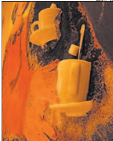
►► Dos dels quadros fets amb elements reciclats d'establiments on ara s'exposen.